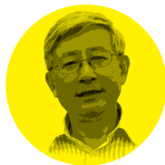
评论 / 曹景行