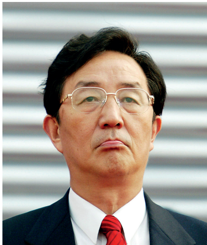
2008年，前中央政治局委员、前上海市委书记因受贿和滥用职权被判有期徒刑18年。

日，天津市第二中级法院认定，陈良宇收受金额折合人民币239万余元，犯受贿罪；在上海社保系列案中存在滥用职权行为，犯滥用职权罪，最终以受贿和滥用职权两罪，判处陈良宇有期徒刑18年。法院未认定陈良宇的玩忽职守罪。陈良宇没有上诉。