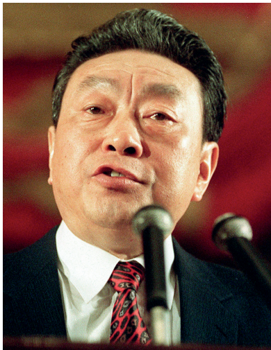
前中央政治局委员、前北京市委书记陈希同因贪腐于1998年被判有期徒刑16年。