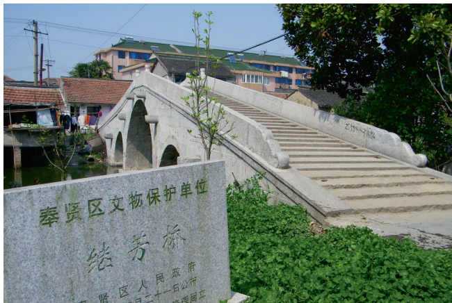
“继芳桥”如今是奉贤区文物保护单位。