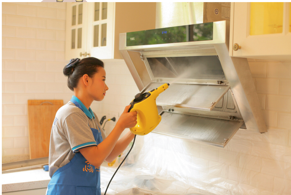
悦管家招聘的阿姨，平均年龄35.3岁，大多是80后。

张媛媛还指出，在传统家政行业 中，家政员上门开始服务后，如 何进一步给用户带来保障是一大痛 点。家政员在雇主家出了事故谁 负责？做了3个月就跑掉怎么办？ 甚至上了年纪的阿姨在服务时， 出现突发性的身体疾病也完全有 可能；在服务