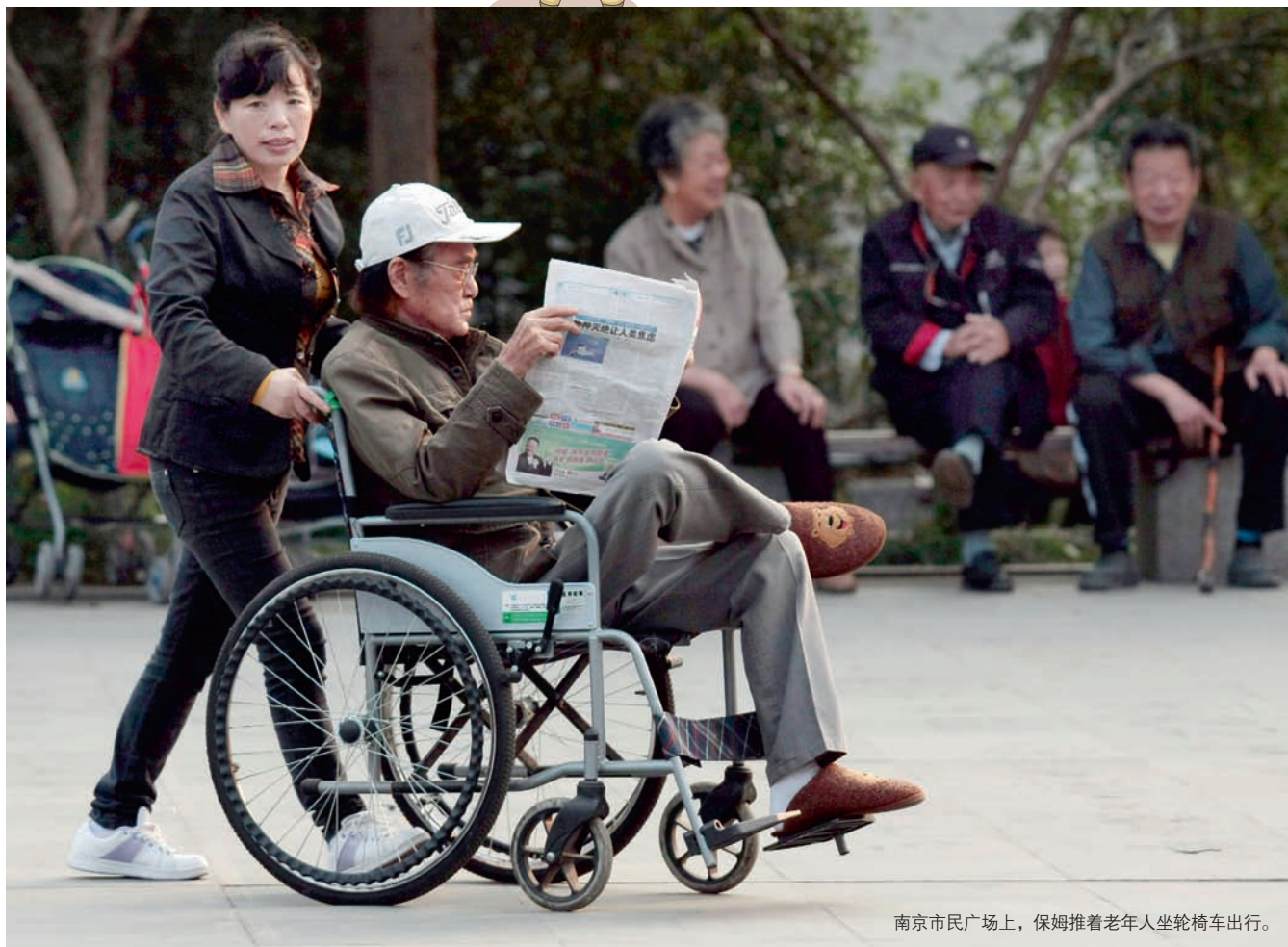
南京市民广场上，保姆推着老年人坐轮椅车出行。