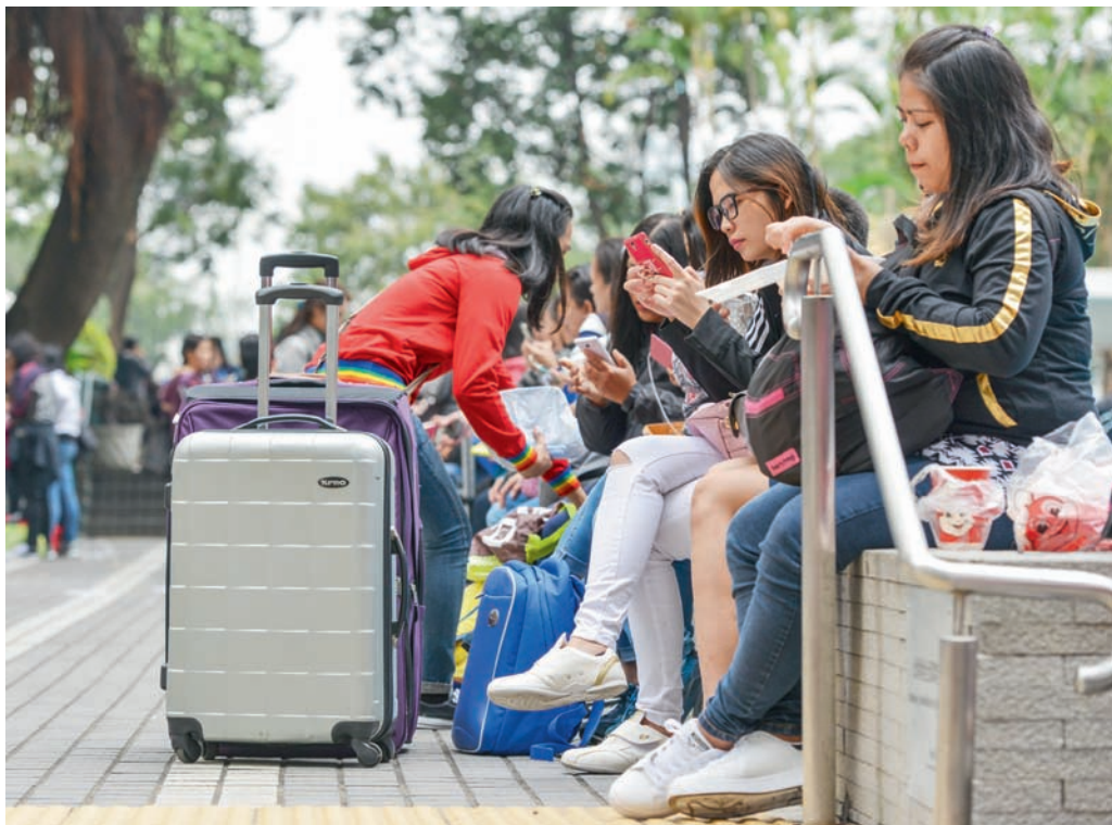
香港有几十万的菲律宾女佣，每到星期六、星期日的休息日，她们也被允许放假。