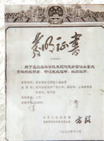
国家发明奖获奖证书。