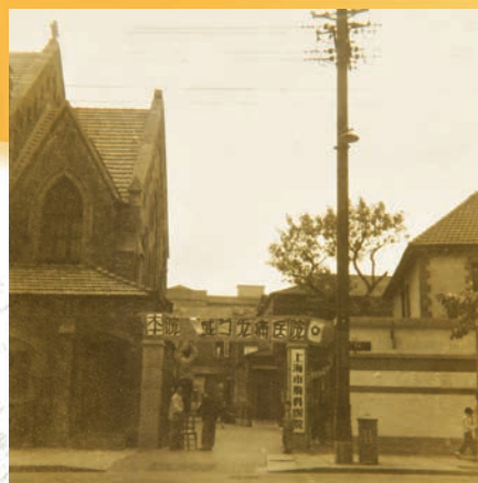
上海市胸科医院原址。