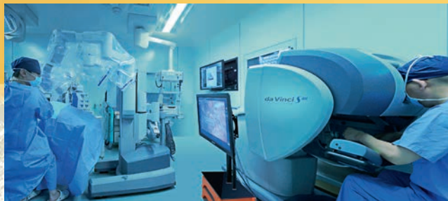
达芬奇机器人胸部手术。