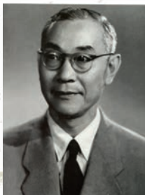
上海市胸科医院首任院长黄家骥。