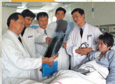
成功施行全国首例成人单侧肺叶移植术。