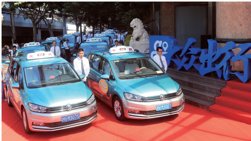
大众出行平台将致力于成为全国性的优质网约车平台。