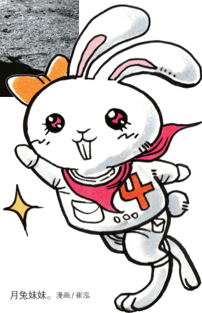
月兔妹妹。漫画/崔泓